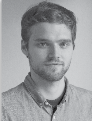
Giorgio Morra www.giorgiomorra.com