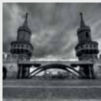
InterCityHotel Berlin-Brandenburg Airport