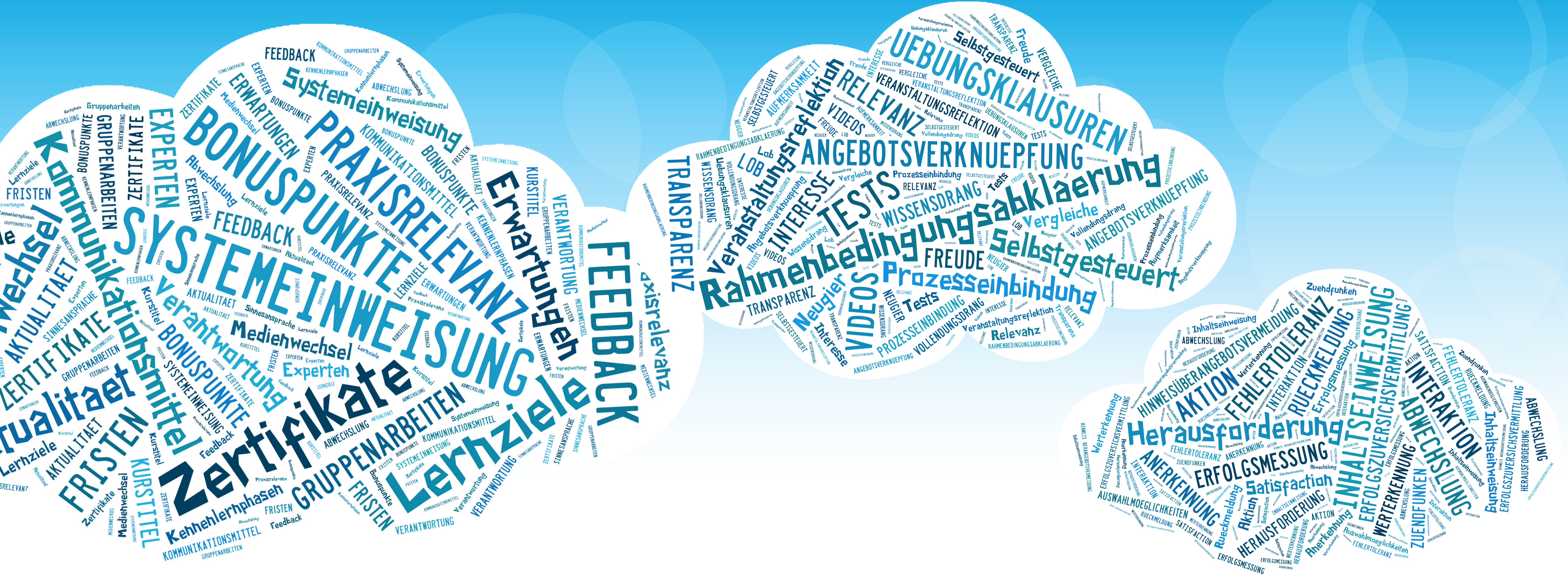
Die oben abgebildeten Tagclouds zeigen ausgewählte motivatorische Anreize in Stichworten.