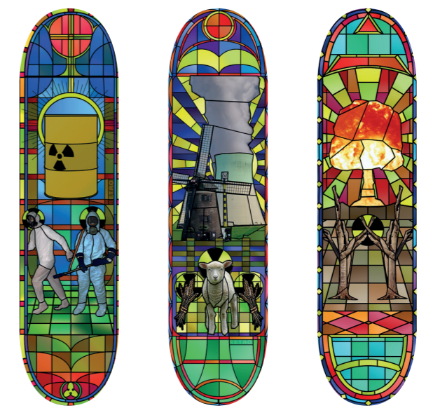
„ENERGIE“ Christian Geisler