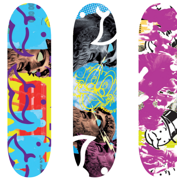
„ZEUSS, DAGOBERT, MONOPOLY“ Arne Vogt