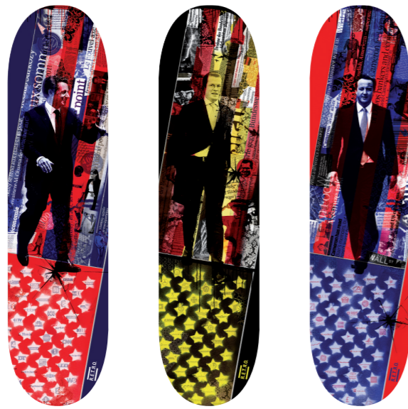
„AMERICAN HOMIES“ Dennis Luck

Eröffnung: Dienstag 07.06.2011, 18 Uhr Galerie Lampingstraße 3, Fachbereich Gestaltung, Fachhochschule Bielefeld