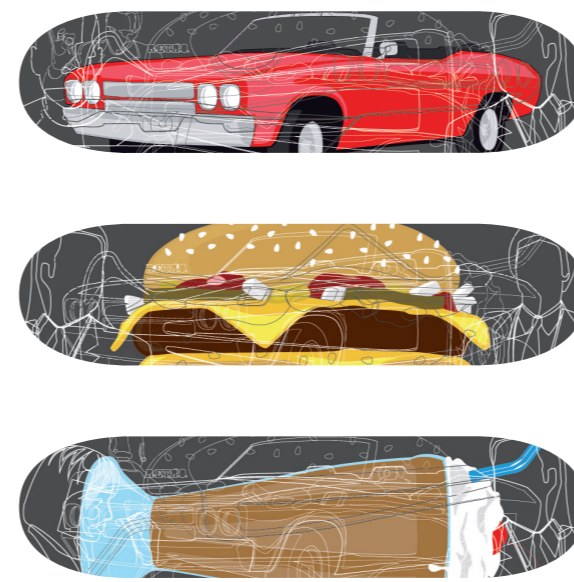
„PULP FICTION“ Niklas Tessmer