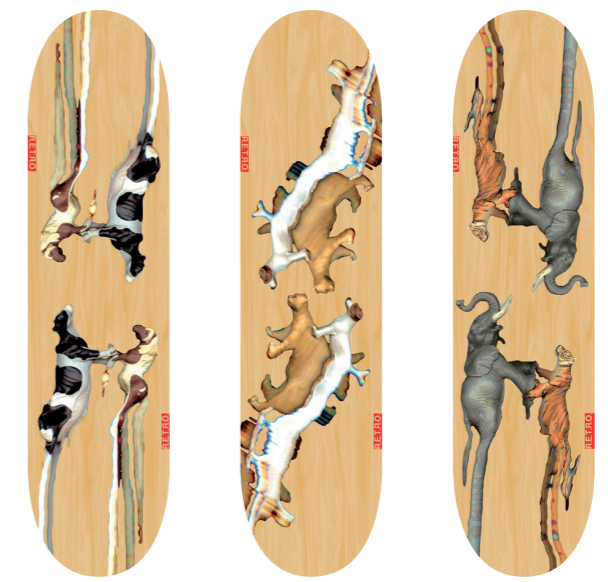
„DANCING ANIMALS“ Heiner Heemann