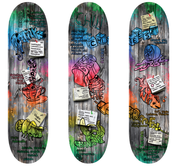
„DELICIOUS FOOD“ Marvin Rissiek