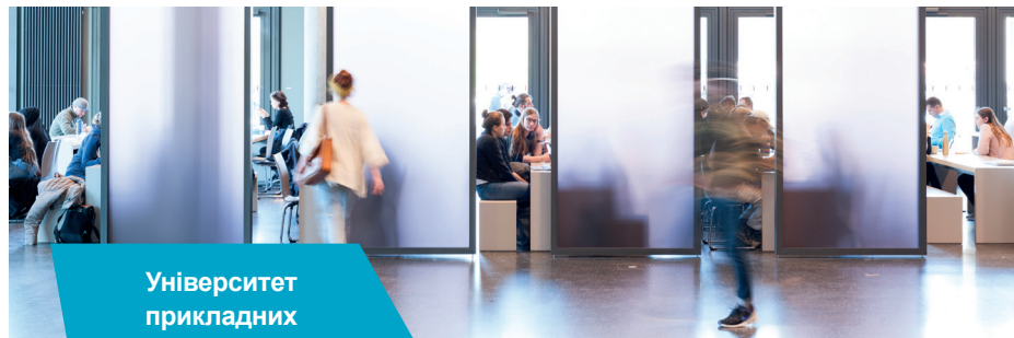
Університет прикладних наук Білефельда