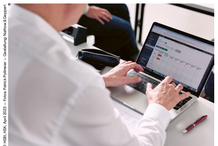
© HSBI, HSK, April 2023 – Gestaltung: Nathow & Geppert

Sprechzeiten für Berufstätige auch abends und samstags