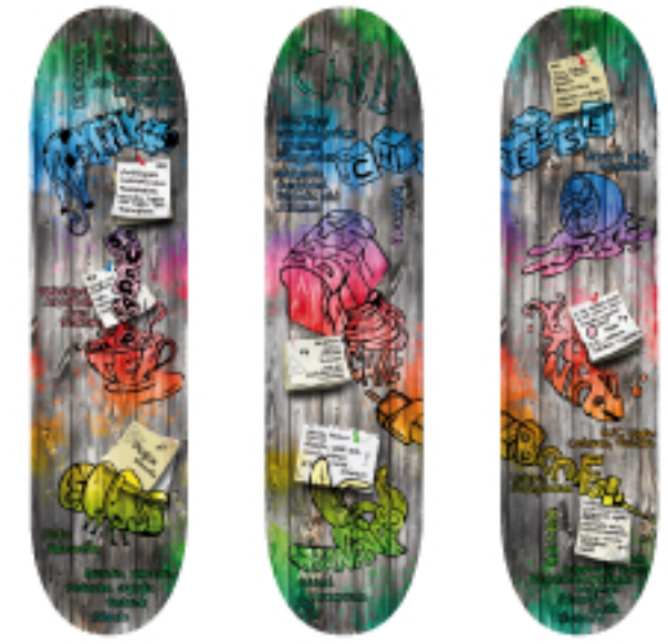
„DELICIOUS FOOD“ Marvin Rissiek