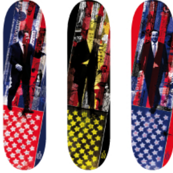
„AMERICAN HOMIES“ Dennis Luck

Eröffnung: Dienstag 07.06.2011, 18 Uhr Galerie Lampingstraße 3, Fachbereich Gestaltung, Fachhochschule Bielefeld