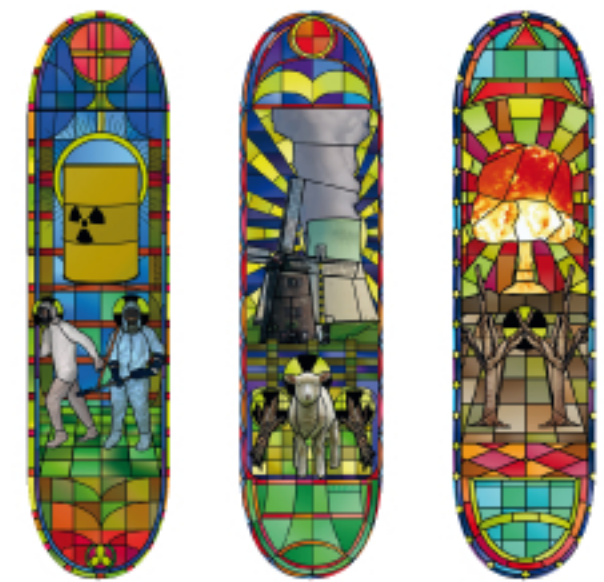
„ENERGIE“ Christian Geisler