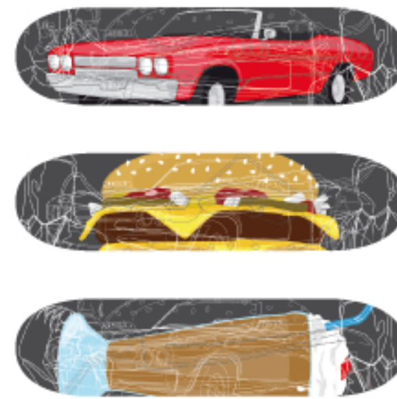
„PULP FICTION“ Niklas Tessmer