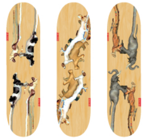
„DANCING ANIMALS“ Heiner Heemann