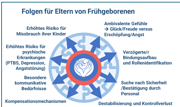
Abb. Folgen einer Frühgeburt für die Eltern und elterliches Erleben[3]